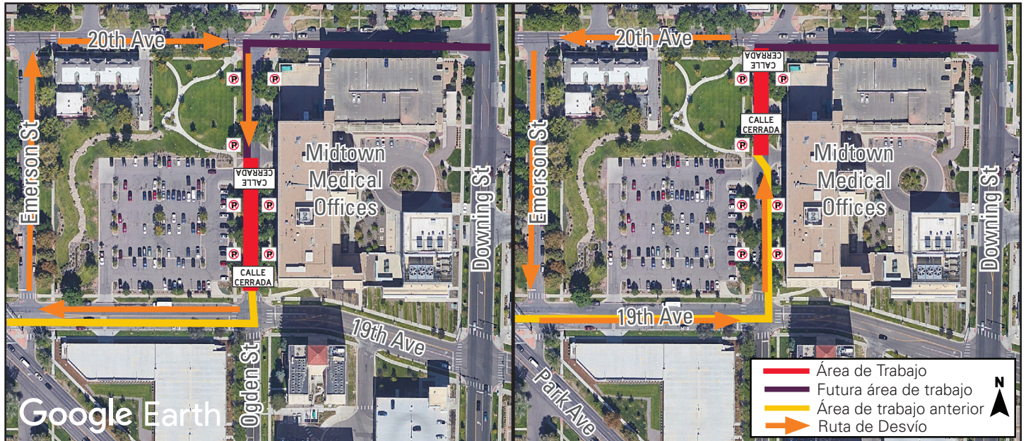
Este mapa es un gráfico y es posible que no muestre ubicaciones exactas