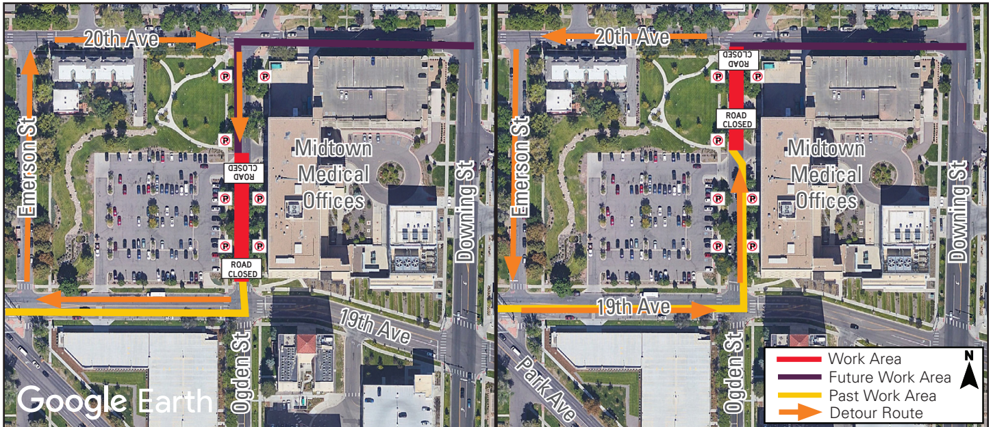
This map is a graphic and may not show exact locations.